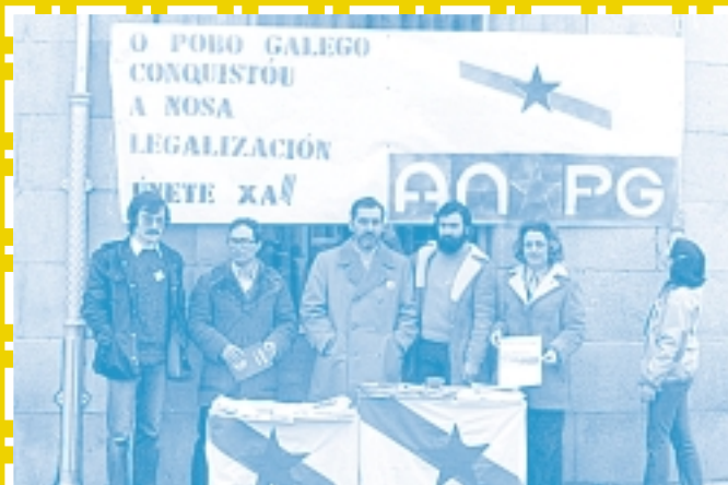
Nunha recollida de sinaturas en Monforte

As vivencias de Manuel María comparten espazos marcados pola represión da ditadura militar de Francisco Franco, até a morte deste en 1975, e a instauración dun novo marco político coa aprobación da Constitución española (1978) e o Estatuto da Autonomía (1980).