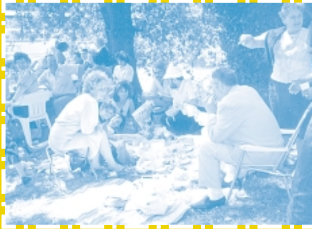
En Compostela, o Día da Patria

Manuel María pretendeu coa súa palabra que as galegas e os galegos fosen conscientes de pertenceren a unha nación, Galiza, que tiña unha historia agachada e un idioma de seu, durante moito tempo marxinado e perseguido. Eis a razón pola que participou activamente na vida política desde o nacionalismo; velaí tamén a causa de que na súa obra Galiza e a reivindicación dos seus sinais de identidade sexan o cerne da súa temática: os feitos e figuras históricas do país, a lingua galega, ... Eis a razón pola que se dirixía sempre a un "vós" (galegas e galegos) e tamén o motivo polo que participaba en calquera acto (conferencias, pregóns, romarías, brindes, poemas ou pezas dramáticas de encarga) que servise para dignificar a súa patria e a súa lingua.