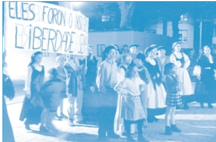
Representación teatral en Carral, A Coruña

DIEGO DA PENELA.- A enliza tena que pagar meu irmau que foi o que vendeu. Eiquí traio a escritura: ólea.